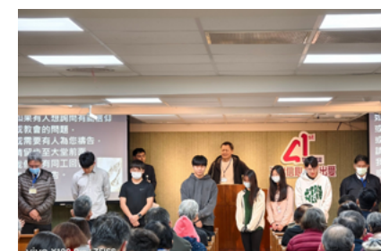
開學前為學生祝福禱告