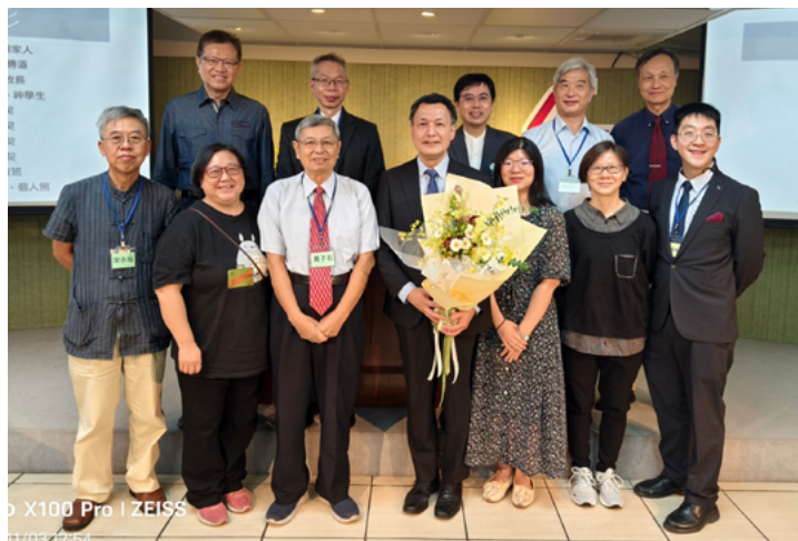
我們敬愛的正人長老退休了